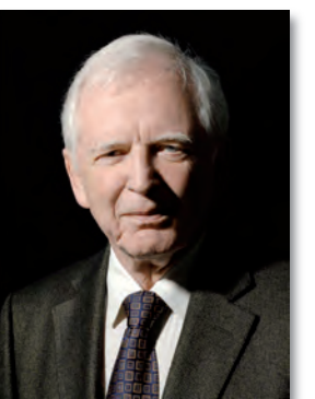
Prof. Harald zur Hausen, Nobelpreisträger

„Krebsvorbeugung wie auch Krebstherapie benötigen medizinischen Fortschritt. Auch die psychosoziale Krebsberatung kann einen wichtigen Beitrag in der Therapie leisten“